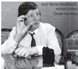
prof. Václav Riedlbauch, ministr kultury České republiky